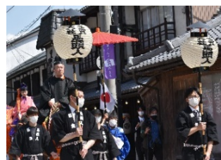
6/5 多賀大社 「お田植祭」