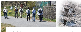
4/9 あるいてまいろう 「多賀三社まいり」