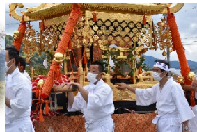
4/22 多賀大社 「古例大祭」