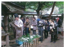
犬上神社愛犬御祈禱