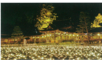
新入社員ふれあい フェスティバル 4/16