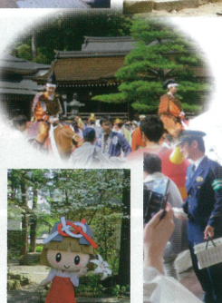
4/6 交通安全啓発活動