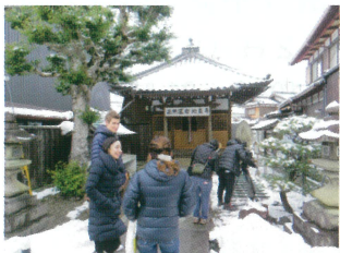
開運！近江の地獄めぐりロケ