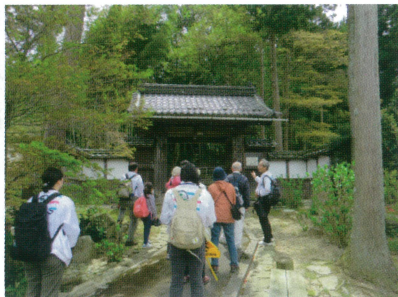
4/14 三社まわり ガイド(高源寺)