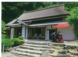
胡宮神社社務所竣工式