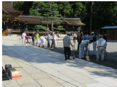
祈りの石ころあかり