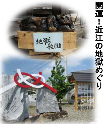
開運！近江の地獄めぐり