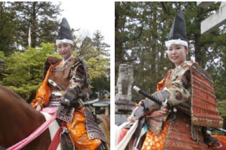
ささゆりむすめ 多賀大社 古例大祭にて 4/22