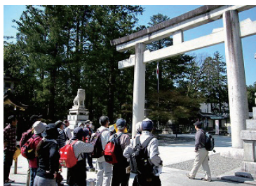
三社まわりガイド 4/13