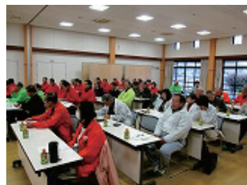
2/18 湖東ブロック ボランティアガイド研修会