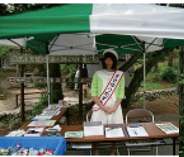
ささゆりむすめ たかとりぶぶるツアーにて 6/9