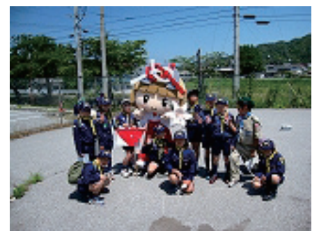
6/8 ボーイスカウト大会