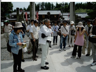
6月2日 in 多賀大社