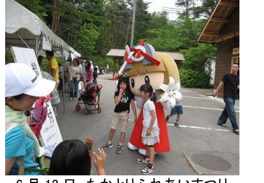
6月13日 たかとりふれあいまつり