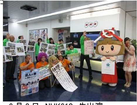
6月8日 NHK610 生出演