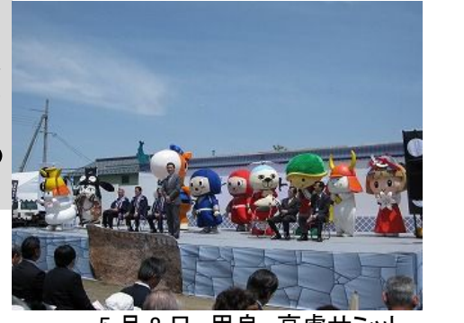
5月8日 甲良 高虎サミット