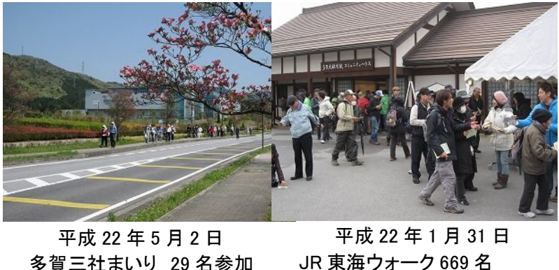
平成22年5月2日 多賀三社まわり 29名参加 平成22年1月31日 JR東海ウォーク 669名

むすめと共に観光キャンペーンや他市町との交流事業などに参加し、多賀の見どころや特産品をPRします。 大勢の方に喜ばれやりのある多賀観光ボランティアガイド強化、HPの充実と活用等。特にまちづくりが地元地域の関心と意識を高められ、そのことで地元の取り組みのきっかけになるようにと考えています。 さらに総会において、多賀町観光協会の一般社団法人化への移行が承認され、それに向け、事務手続きを行います。 大切なことは「いつも美しく」をモットーに「心のふれあいとおもてなしの心」で日々応対し、観光事業を推進していきます。