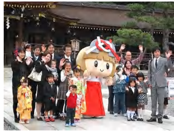
「笑ってパッカーズ」映画公開!