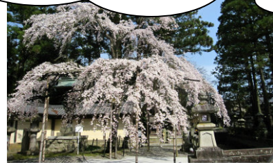
多賀大社 しだれ桜